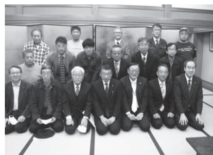
記念式典後の慰労会 (同日の総会後に実施)

表示凡例: 数値は卒業回生、 M:機械科、MS:機械システム科、E:電気科、e:電子科