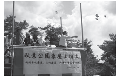
上棟式と言えば古来から餅撒き