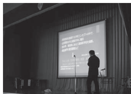
学校長スライド説明

令和4年11月2日、創立60周年記念式典が挙行了されました。開式に際して母校より開催方法について相談を受け、60周年という数値は記念日の重要さからすると比較的軽いので、著名人は招待せず卒業生が在校生に向けてメッセージを届ける形体とする案で決着しました。早々に各世代の卒業生へ講演要請に取り掛かりました。