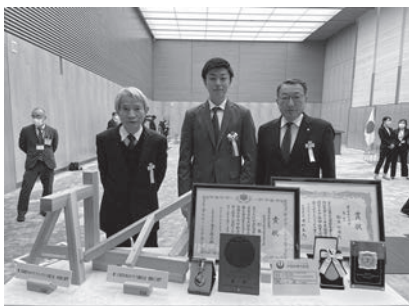
表彰式記念撮影