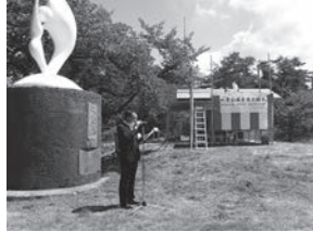
上棟式、学校長挨拶