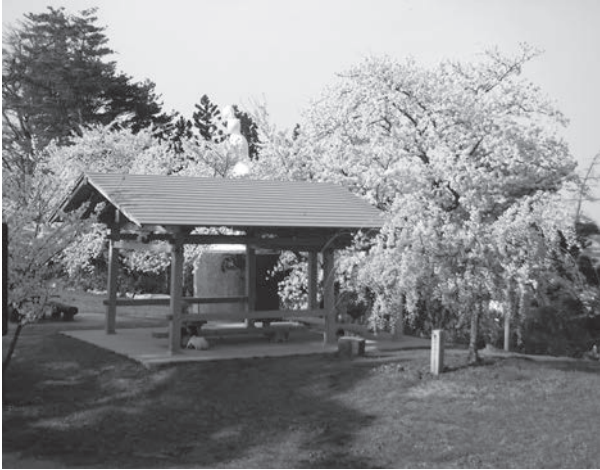
桜の季節に映える東屋(撮影:R5.4.初)

上棟式には同窓会からご祝儀を進呈し、近頃では見かけなくなった餅撒きも体験できました。