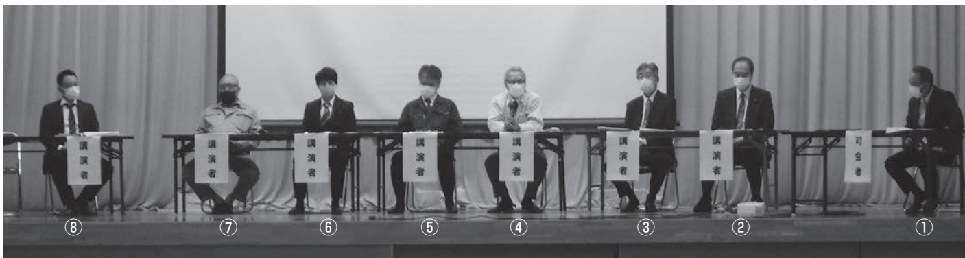
卒業生からのメッセージ登壇者