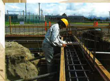
2学年 インターンシップ