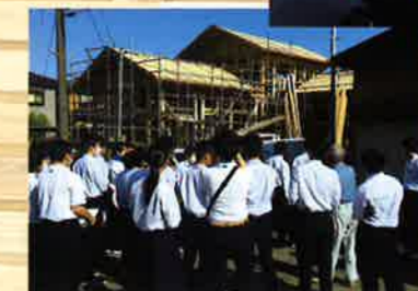
山崎建築(矢代田新築工事現場)