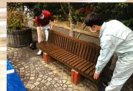
秋葉公園 ベンチ製作

共同作業である建築工事のチームワークの大切さ、「匠の心」を学びます。昨年度は、3坪日本家屋『飛翔亭』の製作や秋葉公園にベンチを製作、設置しました。また、秋葉公園の東屋も途中まで製作し、次年度へ引き継ぎました。