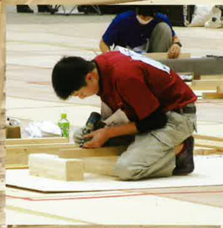
技能五輪全国大会東京大会

令和3年度 高校生ものづくりコンテスト新潟県大会優勝・準優勝 高校生ものづくりコンテスト北信越大会優勝・3位 高校生ものづくりコンテスト全国大会優勝 若年者ものづくり競技大会金賞 技能五輪全国大会東京大会出場