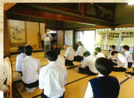
歴史的建築物(椿寿荘)見学