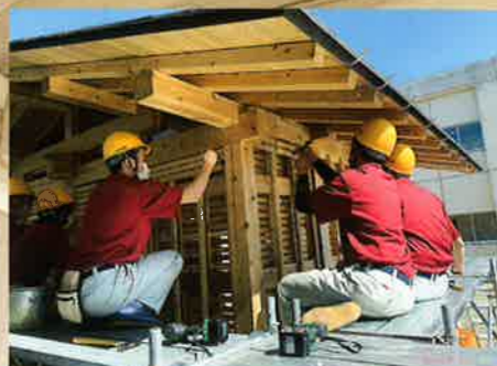
3坪日本家屋『飛翔亭』製作