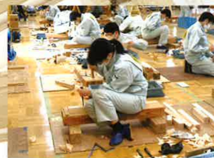
1学年 3級技能検定 試験風景